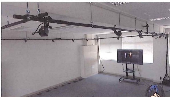
最新型光学式モーションキャプチャシステム

モーションスーツにつけられたマーカーを デジタルに記録し、キャラクタCGを 動かします。 Vtuberはこの部屋で動かします。